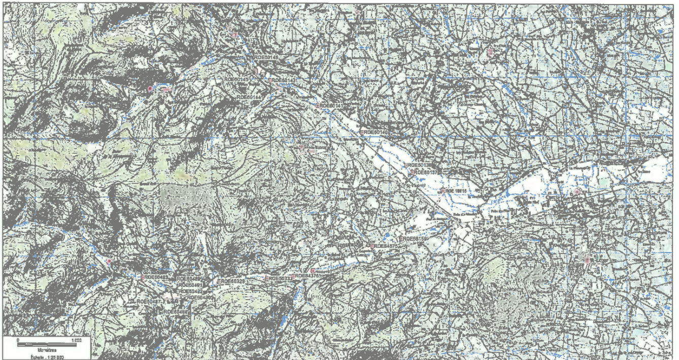
Ardières médianes et ruisseau des Samsons