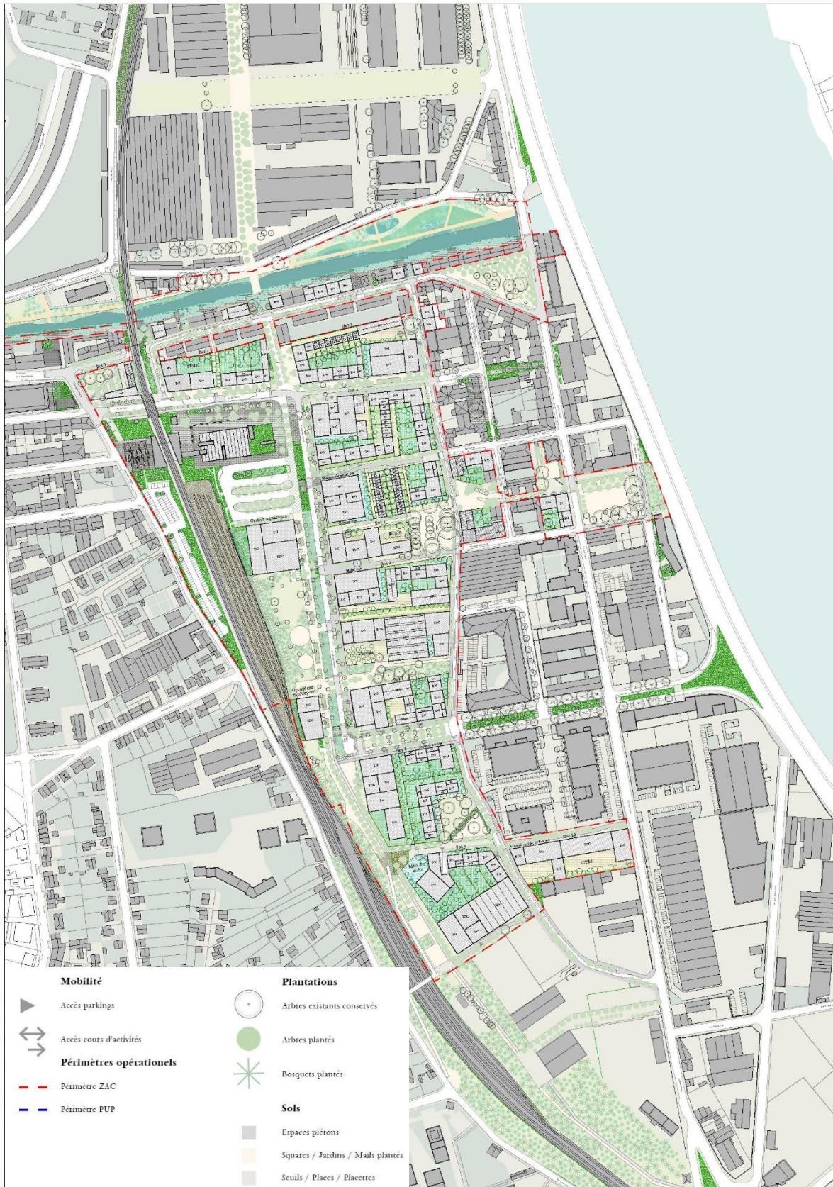
Plan 1 : Plan de composition de la ZAC la Saulaie - TVK - Septembre 2022